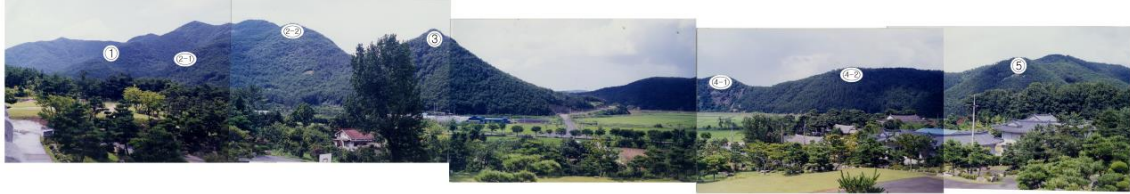
(1) 설레바위봉 (2-1) 현재 기도하고 있는 상여바위봉 중턱 너럭바위 (2-2) 상여바위봉 (3) 옥녀봉 (4-1) 현재 영산원불교대학교에서 기도하고 있는 변화된 마흔앞산봉 (4-2) 마흔앞산봉 (5) 촛대봉