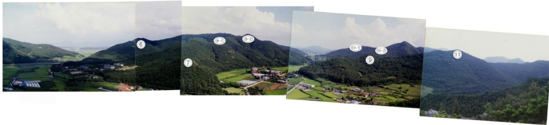
(6) 장다리봉 (7) 중앙봉 (8-1) 대파리봉 (8-2) 현재 익산 원불교 대학교에서 기도하고 있는 곳 (9) 눈썹 바위봉 (10-1)공동묘지봉 (10-2) 현재 영산 원불교 대학교에서 기도하고 있는 공동묘지봉 (11) 밤나무골봉